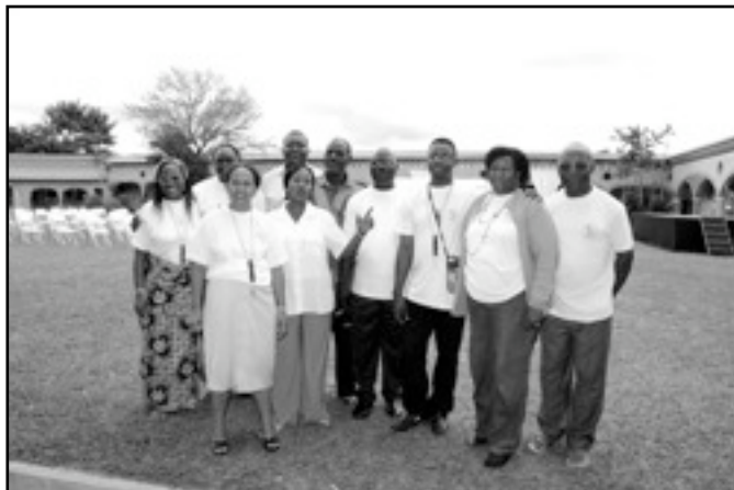
Participantes de Africa en la RM10

En todos los proyectos de acción de los continentes, hay varios puntos recurrentes: