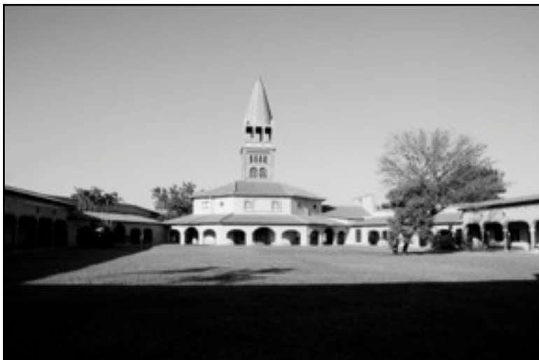
Complejo Marianella, Atyra (Paraguay) - Marzo de 2010