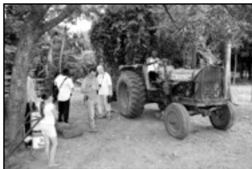
Visita en el Campo, Paraguay

La agricultura industrial y con vocación de exportación fomentada por la revolución verde ha provocado problemas medioambientales graves y el hecho de que se haya expulsado a los campesinos de sus tierras hace del éxodo rural una realidad. Las patentes sobre organismos vivos, los derechos de propiedad intelectual y los OGM (Organismos Genéticamente Modificados) han llevado a la pérdida de la casi totalidad de las semillas tradicionales. Hoy, los campesinos están enfrentando costes cada vez más elevados para la compra de semillas porque los OGM no permiten su conservación o reproducción para otras siembras. Los OGM no permiten el acceso de las comunidades rurales a una alimentación tradicional que es culturalmente más aceptable y preferida por estas poblaciones. Los OGM amenazan la biodiversidad y hacen correr grandes riesgos al medio ambiente. Durante siglos, millones de campesinos han mejorado su producción de semillas y plantas usando prácticas de agricultura sostenible basadas en materiales locales y renovables y que han participado en el conocimiento de los saberes tradicionales.