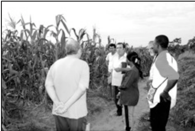
Encuentro con campesinos en el campo

Estado, y sólo cuentan con sus propios recursos para salir de la pobreza.