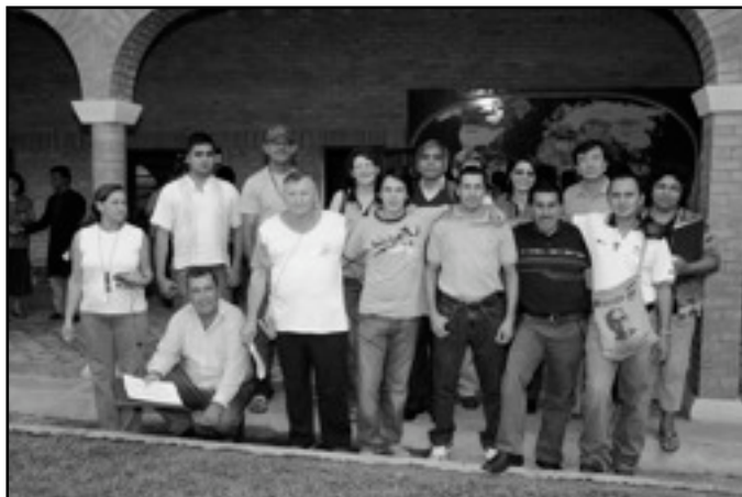
Participantes de América del Sur en la RM10

Apoyar y utilizar la educación popular para compartir, difundir y promover los temas que se trabajaran (Decrecimiento, Menos es Mas, Migraciones así como también Soberanía Alimentaria, Economía Solidaria, Buenas Gobernanzas, y otros temas que puedan surgir y se deban de apoyar por el bien del continente)