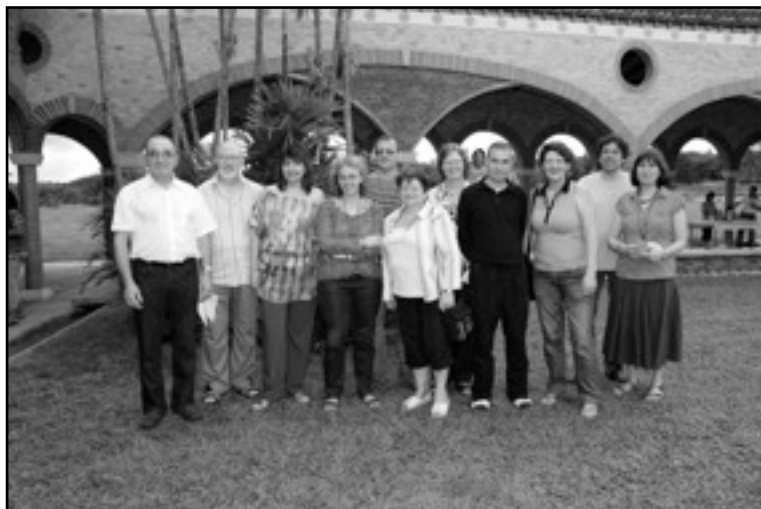
Participantes de Europa en la RM10

Para terminar, la cuestión de los recursos financieros es importante. Cada movimiento deberá buscar recursos en su propio país para desarrollar el trabajo europeo.