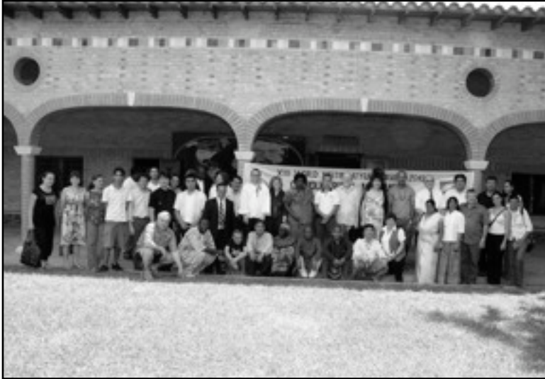
XIII Encuentro Mundial - Atyra (Paraguay) del 10 al 25 de Marzo 2010

De regreso del Encuentro Mundial de Atyra, es con un renadío de energía que retomamos contacto con ustedes y con la gran red de FIMARC para compartir estos momentos fuertes de un Encuentro Mundial.