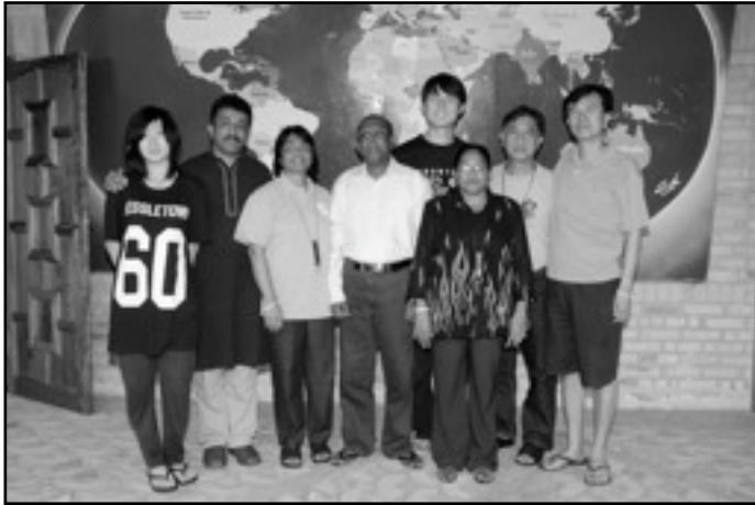
Participantes de Asia en la RM10

Cada movimiento tendrá que encontrar los recursos financieros para realizar este encuentro. Se han seleccionado dos grandes ejes: el seguimiento y la evaluación de las acciones de los años anteriores; el compartir de las realidades de cada país y movimiento, experiencias y nuevos conocimientos.