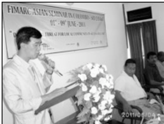
Seminario asiático, Colombo (Sri Lanka)

Los Movimientos miembros de la FIMARC recibirán próximamente una llamada a la acción y os pedimos que de ahora en adelante os preparéis para esta jornada..