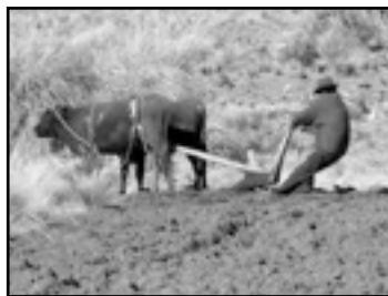
Bolivia (P.H.L. Tillieux)

En Bolivia, para la población indígena, la Madre Tierra es omnipresente. Ella recibe cada día su trago de alcohol, su cuota de granos de maíz, unas cucharadas de sopa. Una multitud de ofrendas que incluso - y sobre todo - los más pobres entre los pobres nunca se olvidan de pagar. Porque la "Pachamama es la vida", dicen en los Andes.