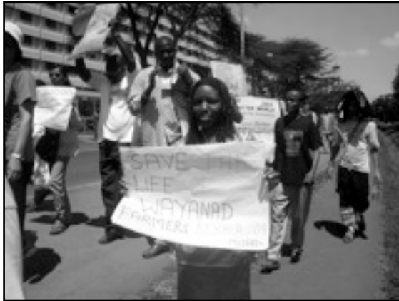
Marcha para la supervivencia de los agricultores de Wayanad (Kerala, India) - 2007 FSM Kenia (MIJARC)