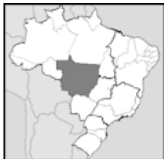
Mato Grosso - Brasil

Además de abastecer el mercado interno por completo, Brasil se convirtió en el segundo exportador de bioetanol. Y por esta razón las tierras del Mato Grosso son cada vez más solicitadas para producir el bioetanol, que ahora es muy popular. El 65% de las nuevas inversiones en bioetanol del país se realizan en esta región.