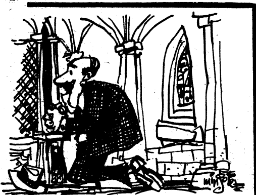
EL CONCILIO RENOVADOR

El resultado es que las iglesias parroquiales o diocesanas son un poco o un mucho lo que son sus ministros ordenados. Y así, sin participación y colaboración real, no hay comunidad viva y nos hemos convertido en una institución religiosa, organizada, con pocas posibilidades reales de ofrecer a los hombres el signo y la levadura del Reino de Dios.